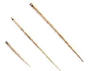
Des aiguilles à chas (trou) en os (vers 14 000 avant J.-C.).

Homo sapiens utilisait des aiguilles pour coudre ses vêtements en peau.