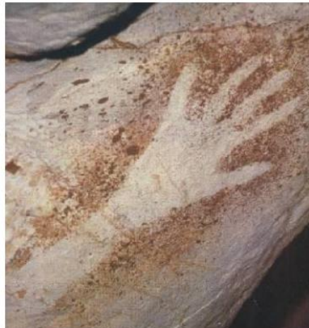
Main peinte, vieille de 27 000 ans, Grotte Cosquer (Marseille)