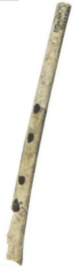
Flûte en os, vieille de 20 000 à 30 000 ans, Isturitz (Pyrénées-Atlantiques)

Dans les grottes, qui étaient sombres, les artistes de la préhistoire s'éclairaient avec des lampes alimentées en graisse de renne.