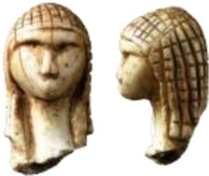
Vénus de Brassempouy, en ivoire, vieille de 23 000 ans (Landes)