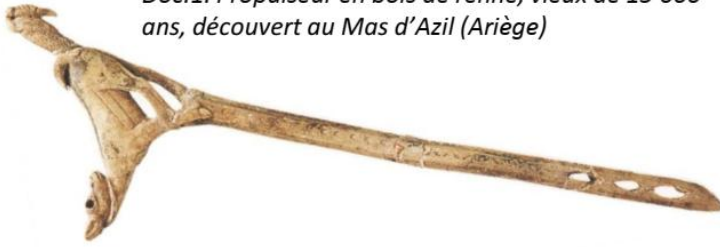
Doc.1. Propulseur en bois de renne, vieux de 15 000 ans, découvert au Mas d'Azil (Ariège)

Les archéologues ont étudié cet objet et ont cherché à quoi il pouvait servir. Ils pensent qu'il s'agit d'un propulseur qui permettait de lancer des flèches.