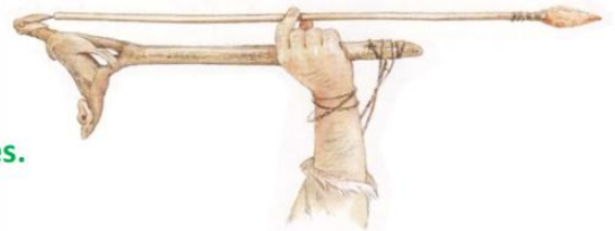
Doc.2. Utilisation d'un propulseur (reconstitution) [Magellan - Hatier]

Cela nous apprend qu'ils chassaient pour se nourrir.