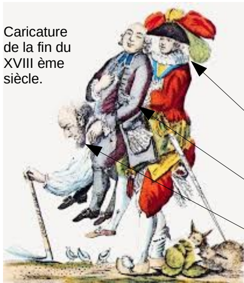
Caricature de la fin du XVIIIème siècle.

A la fin du XVIIIème siècle, il existe trois ordres en France : La Noblesse, le Clergé et le Tiers Etat.