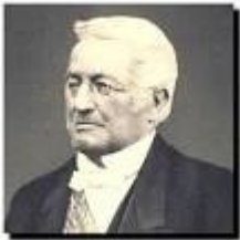
Adolphe THIERS , président de la République de 1871 à 1873.