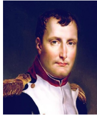
Napoléon Bonaparte , Premier Consul de 1799 à 1802, puis empereur de 1804 à 1814.