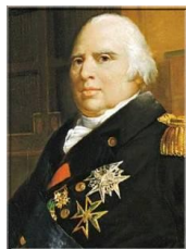
Louis XVIII , roi de France de 1814 à 1824.

CONSIGNE : Ecris le nom de ces personnages historiques au bon endroit sur la frise de la page 1.