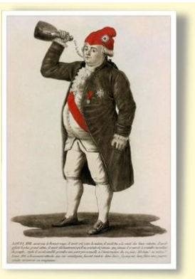
Caricature du roi que l'on oblige à boire à la santé des révolutionnaires et à porter le bonnet phrygien.