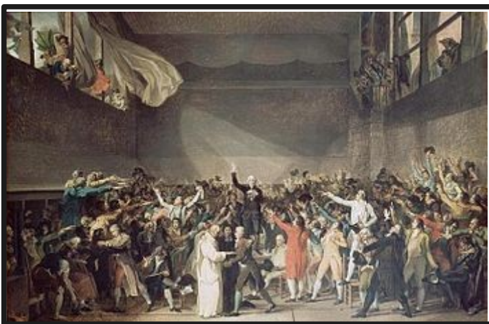
Le serment du jeu de Paume, tableau inachevé de DAVID, composé en 1792.

Le roi Louis XVI décide de réunir les Etats Généraux le 5 mai 1789 à Versailles. Enfin, le roi ne propose aucune réforme. Très mécontents, les députés du Tiers Etat se proclament Assemblée Nationale . Ils se réunissent le 20 juin dans la salle du jeu de paume à Versailles où ils jurent de ne jamais se séparer avant d'avoir donné une Constitution à la France. ♥