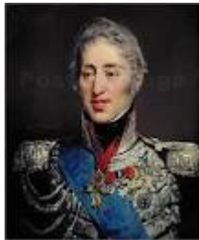
Charles X , roi de France de 1824 à 1830.