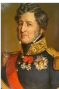
Louis Philippe 1er , Roi des Français de 1830 à 1848.