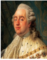
Louis XVI , roi de France de 1774 à 1792.