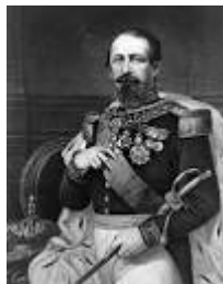
Charles Louis Napoléon Bonaparte , est le premier président de la République française, élu le 10 décembre 1848 au suffrage universel masculin, avant d'être proclamé empereur des Français le 2 décembre 1852 sous le nom de Napoléon III.